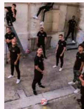
Team S3 Freestyle