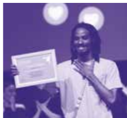
Contest Time 2 show

— Détail de la programmation sur le site internet : www.auditoriumseynod.com