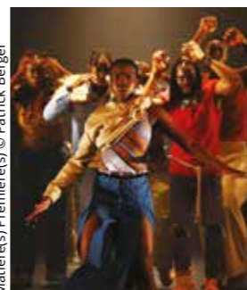
Matière(s) Première(s)