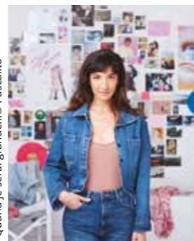
Quand je serai grande...

Pass Nuit : 4 films 20 € Tarifs habituels pour des séances distinctes.