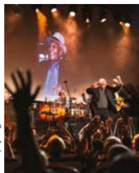
Compay Segundo